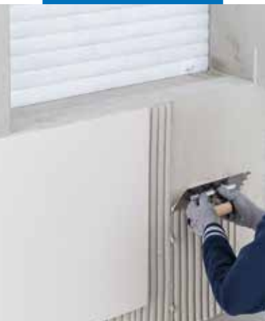
Posa di piastrelle in ceramica di grande formato