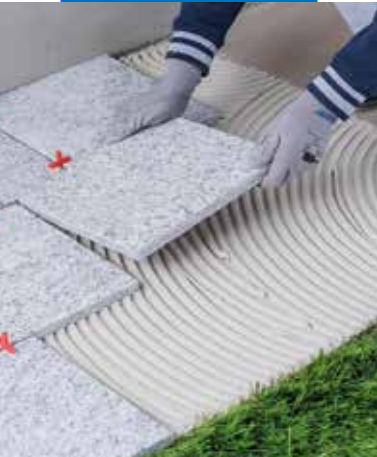
Posa di pietra naturale all'esterno