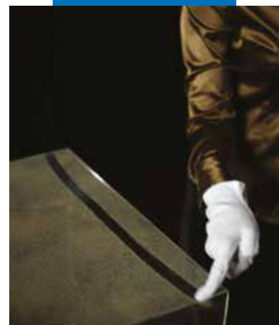
Con prodotto cementizio tradizionale